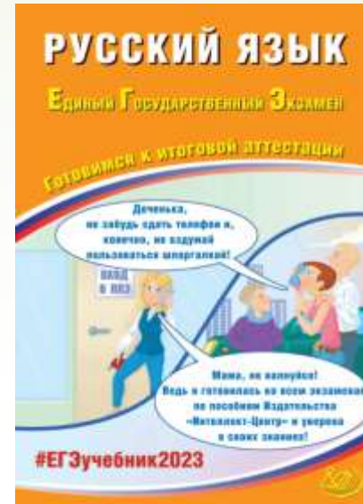
Русский язык. ЕГЭ. Готовимся к итоговой аттестации. С.В. Драбкина, Д.И. Субботин