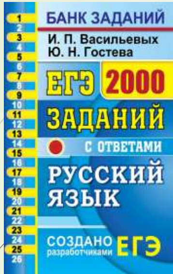
ЕГЭ: 2000 заданий с ответами по русскому языку. И.П. Васильевых, Ю.Н. Гостева