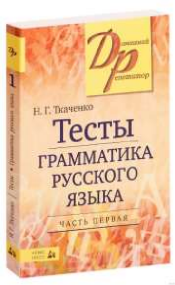
Тесты по грамматике русского языка. Н.Г. Ткаченко