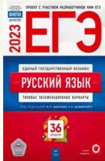
ЕГЭ 2023 Русский язык. И.Цыбулько