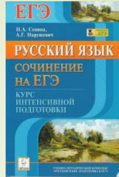
Русский язык. Курс интенсивной подготовки. Сочинение на ЕГЭ. Нарушевич А.Г., Сенина Н.А.